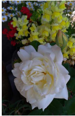
ネージュパルパン 鉢植えです。 蕾(右)が一昨日、開きました(左)。

これからの一ヶ月あまりが庭の最盛期ですね。庭のガーデナー(残念ながら私ではありませんよ)いわく、「十一ヶ月のメンテナンスはこの日のためにあつた」かのような花々の競演が始まります。五月中旬から六月はじめてがローズガーデンとなります。