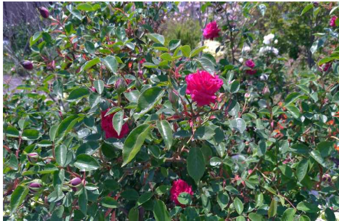
薔薇 プタオホン(葡萄紅)

これからの一ヶ月あまりが庭の最盛期ですね。庭のガーデナー(残念ながら私ではありませんよ)いわく、「十一ヶ月のメンテナンスはこの日のためにあつた」かのような花々の競演が始まります。五月中旬から六月はじめてがローズガーデンとなります。